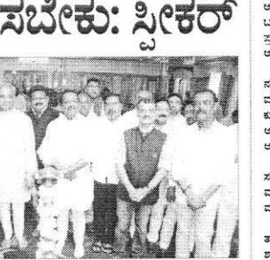
ವಿಧಾನಸಭೆಯಲ್ಲಿ ಸ್ಪೀಕರ್ ಅವರ ಭಾಷಣ.

ಬೆಂಗಳೂರು, ಫೆ.9: ವಿಧಾನಸಭೆಯಲ್ಲಿ ಶಾಸಕರು ಕಲಾವಿದರ ನಿಯಮಗಳನ್ನು ಕಟ್ಟುನಿಟ್ಟಾಗಿ ಪಾಲಿಸಬೇಕು ಎಂದು ಸ್ಪೀಕರ್ ಹೇಳಿದರು.